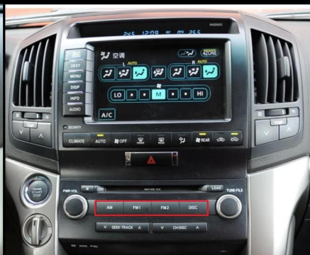
B高配不带光纤小头（保留CD） CD面板上没有AUX或者USB按键是不带光纤，带显示屏为高配。（改装后CD可用）