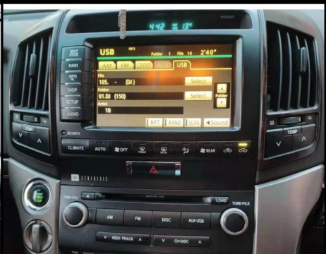
C高配小头带光纤 CD面板上有AUX或者USB按键带光纤，带显示屏为高配。（改装后CD不可用）