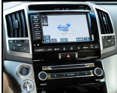
A高配大头带光纤 CD面板没有AM/FM按键，带显示屏为高配。（改装后CD不可用）