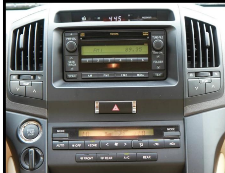
D中低配 原车没有显示屏，有空调面板和空调显示镜为中低配。